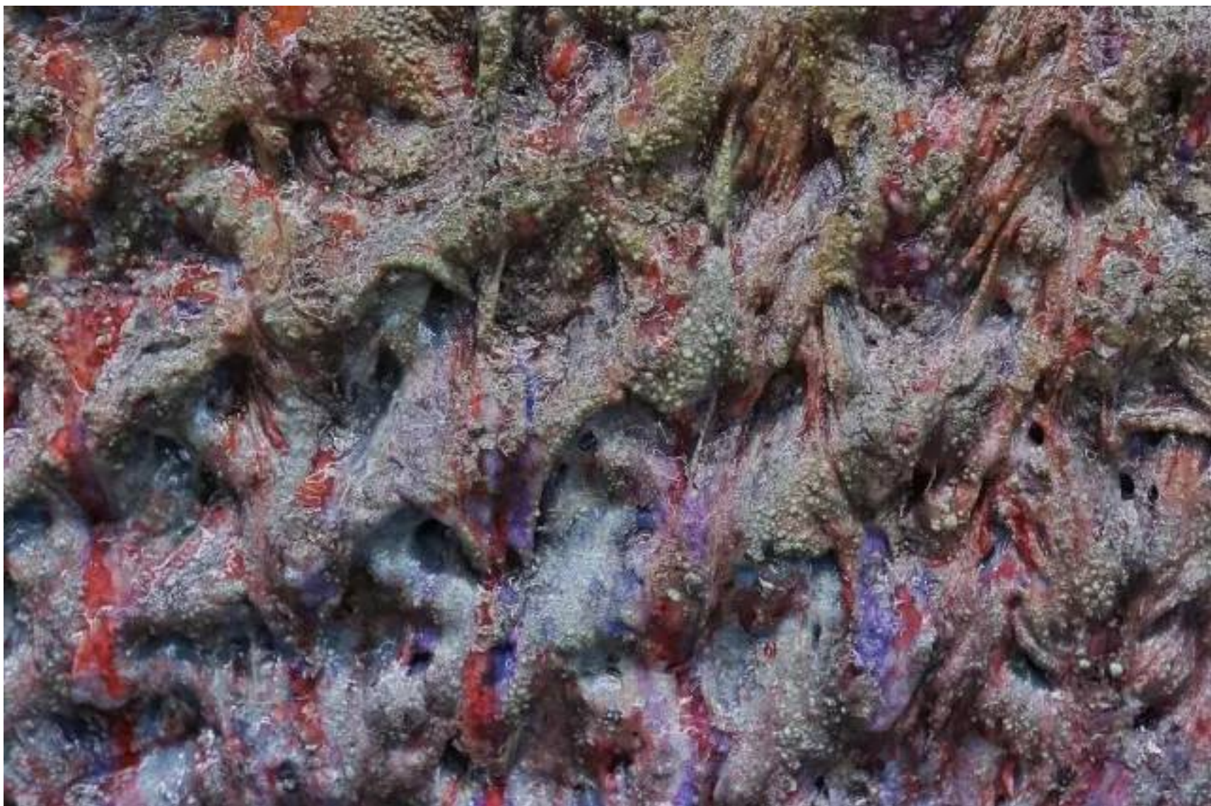
李竞雄，《白银#6》（局部），2016，钢板综合材料，750 x 215cm.

线条以及被层层烧糊的胶漆桎梏的铁丝网，艺术家创作的身影仿佛就在眼前浮现，而这些隐约又与题目有所关联的黏稠、纠缠不清的幻影，成为了观众最终的体验。